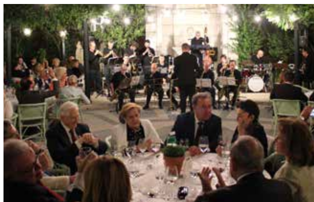
Lisbon Swingers Big Band no jardim do Grémio Literário.

Valeria a pena, sem dúvida, estudar com mais detalhe e mais rigor este lugar que a Música sempre ocupou na actividade do Grémio Literário, e estou convencido de que desse olhar aprofundado poderão vir à tona novos dados relevantes para o conhecimento de aspectos desconhecidos da vivência musical lisboeta, no seu todo, e da própria interacção estreita dessa vivência com o panorama de conjunto do habitus cultural das elites portuguesas. Mas o que salta à vista, logo desde um primeiro olhar, ainda disperso, sobre os inúmeros testemunhos documentais disponíveis, é que o Grémio – casa prestigiada de Cultura, por definição – foi também, desde sempre, e continua a sê-lo, uma casa de Música.