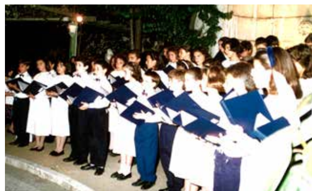
Pequenos Cantores do Grémio Literário.