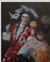
Carnaval (da série “A morte e a donzela”) Óleo sobre tela 81 x 65 cm

A Fundação Henrique Leotte vai promover, no Grémio Literário, uma exposição da sua colecção de obras do artista John O'Connor, nosso consócio, em que serão apresentadas diversas pinturas a óleo incluindo a série “A morte e a donzela”, além de aguarelas e desenhos sobre paisagens portuguesas que foram publicados nos livros deste artista.